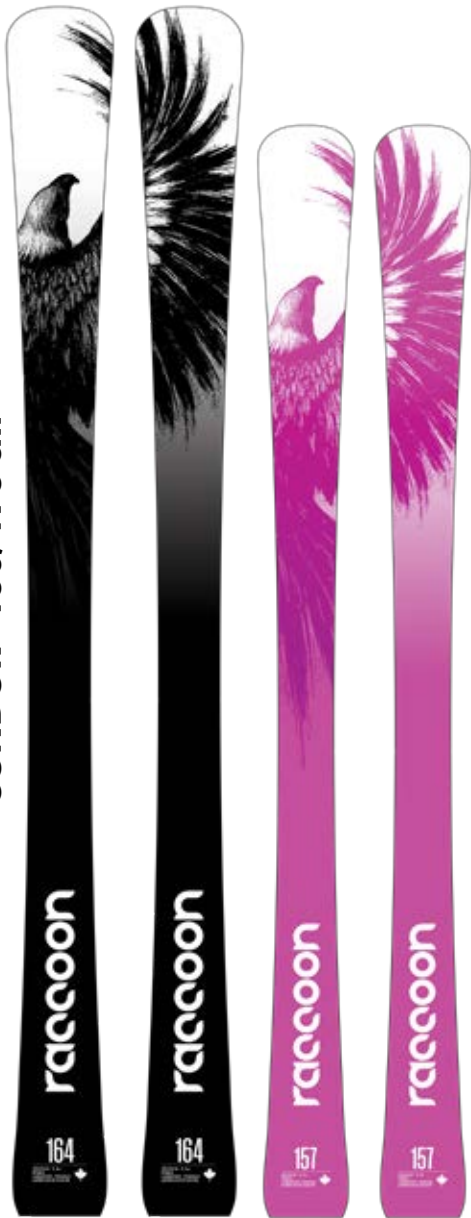
CONDOR - 150/178 cm

Noyau 70% Peuplier 30% Érable Lamination triaxiale Fibre de Verre Carres Edge 48-C Rockwell