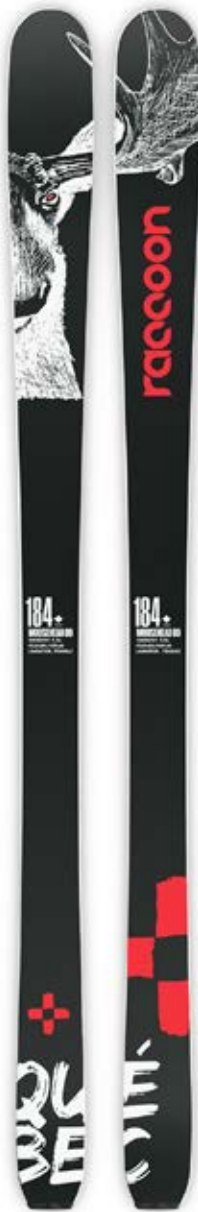
PATROUILLE- 164/184 cm

Noyau Érable - Sauf Taille 150 Composé de 20 % Lamination triaxiale + Construction titanale pour l'homme Carres Edge 48-C rockwell